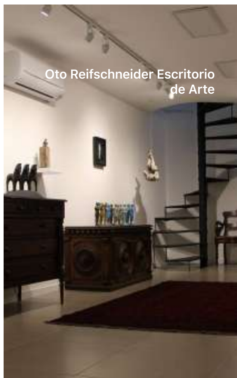
Oto Reifschneider Escritório de Arte