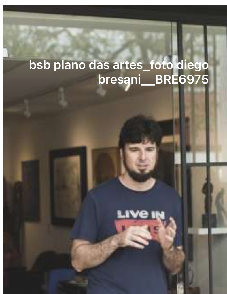
bsb plano das artes_foto diego bresani__BRE6975