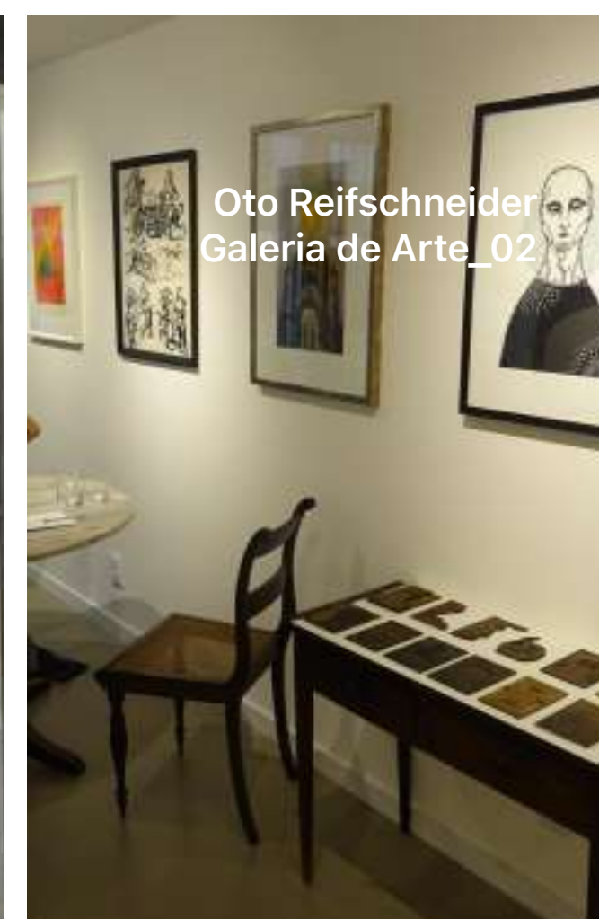
Oto Reifschneider Galeria de Arte_02