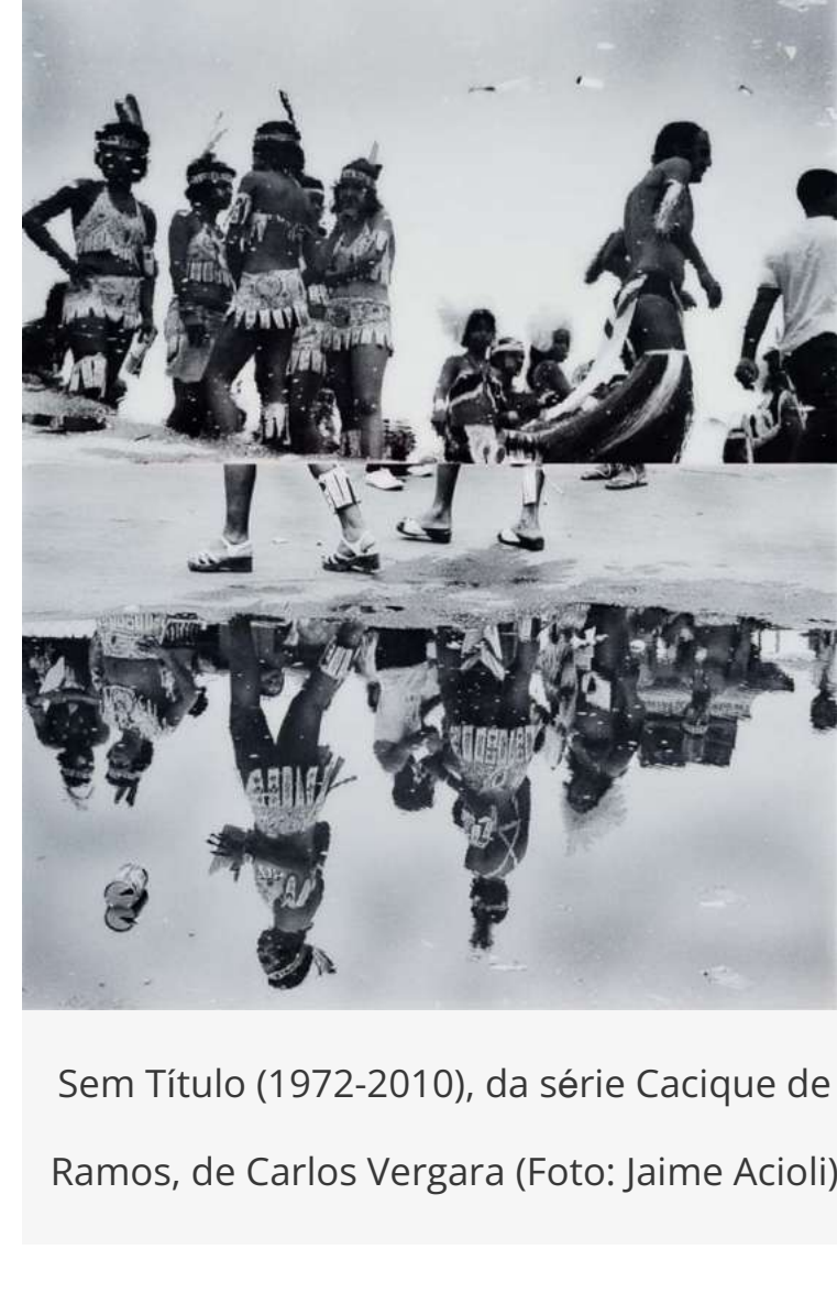
Sem Título (1972-2010), da série Caciqüe de Ramos, de Carlos Vergara