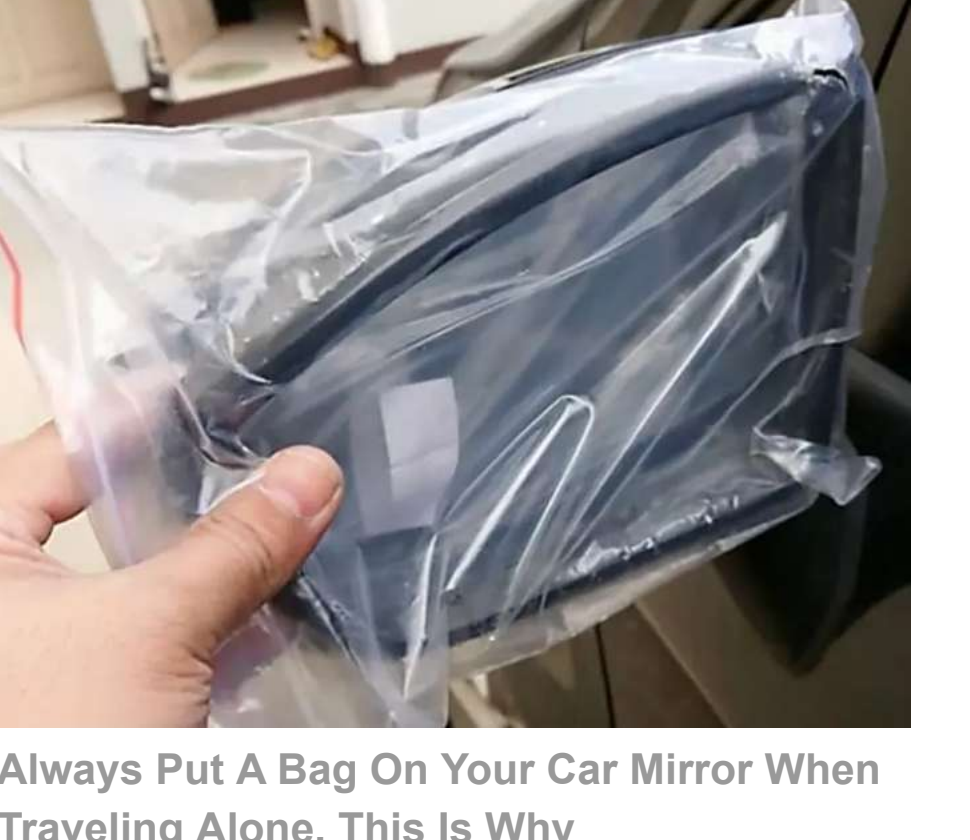
Always Put A Bag On Your Car Mirror When Travelling Alone, This Is Why CraftThought