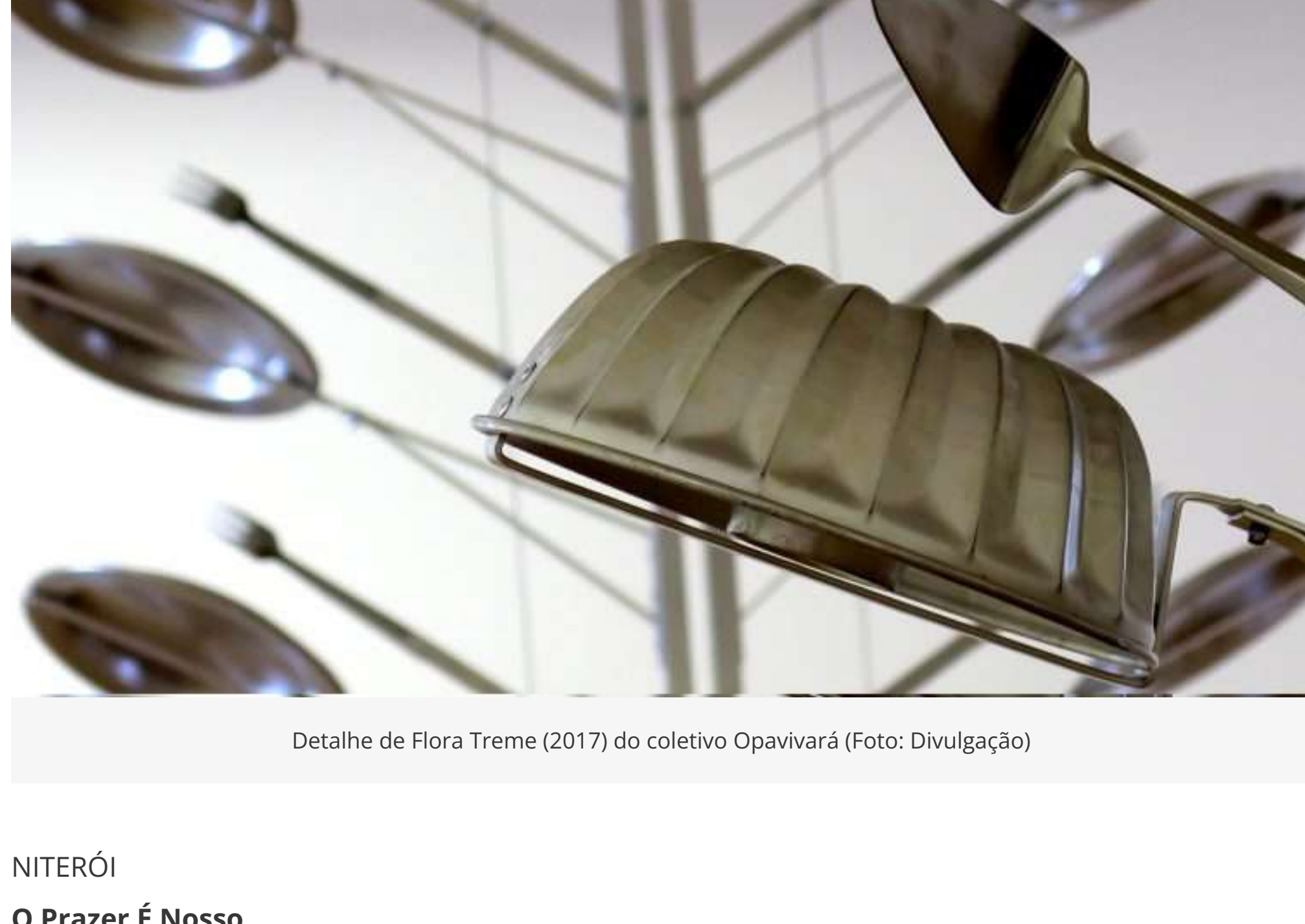
Detalhe de Flora Treme (2017) do coletivo Opavivará

NITERÓI O Prazer É Nosso Individual de Opavivará, de 22/12 a 1/3/2020, MAC, Mirante da Boa Viagem | culturanteroi.com.br/macniteroi