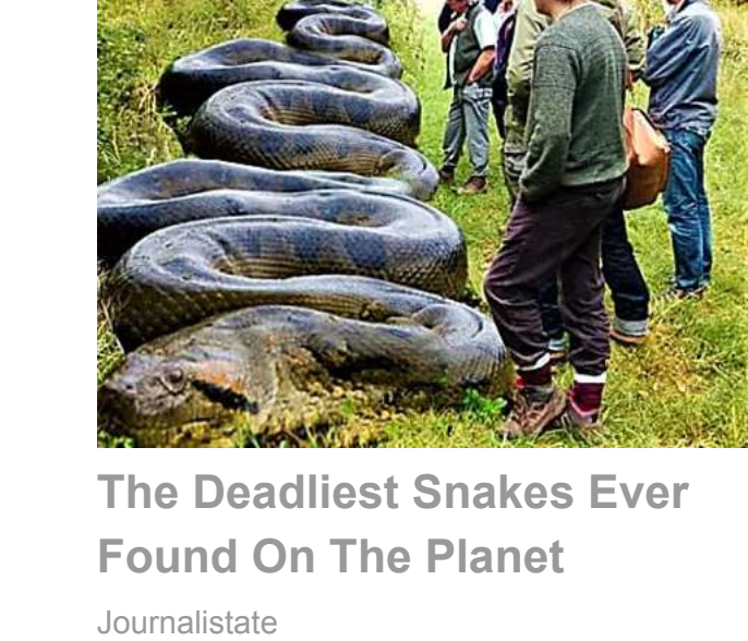
The Deadliest Snakes Ever Found On The Planet Journalistate