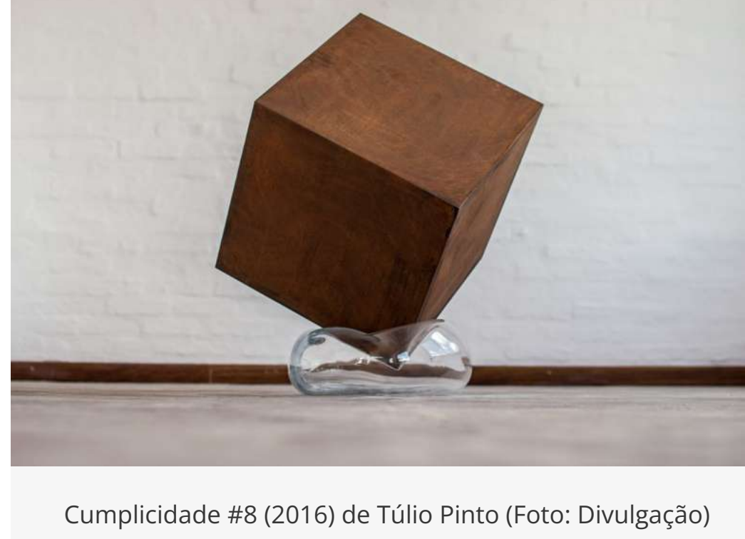
Cumplicidade #8 (2016) de Túlio Pinto

Gostem Ou Não — Artistas Mulheres No Acervo Do MARGS, exposição coletiva, até 22/3/2020, MARGS, Praça da Alfândega, s/n | margs.rs.gov.br