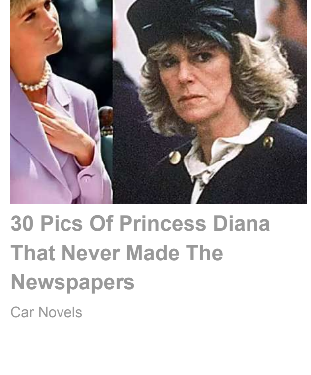
30 Pics Of Princess Diana That Never Made The Newspapers Car Novels