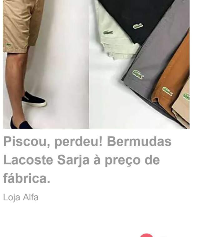
Piscou, perdeu! Bermudas Lacoste Sarja à preço de fábrica. Loja Alfa